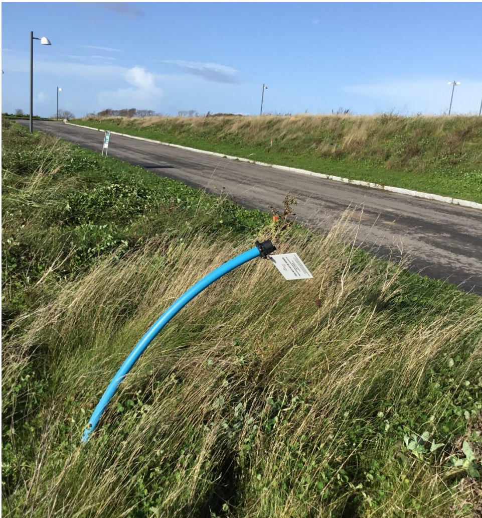
Vandstik plomberet med svejemuffe og skilt. Plombering må kun brydes efter tilladelse fra Hjørring Vandselskab.

Hvis der ikke ansøges om byggevand, vil vandstik derfor være plomberet indtil VVS-installatør kontakter os og færdigmelder ejendommens installationer til brugsvand. Vi giver derefter tilladelse til at bryde plomberingen på vandstikket, så VVS-installatør kan koble ejendommens jordledning til vores stikledning, og kommer samme dag og opsætter vandmåleren på den færdige installation. Kontakt os i god tid.