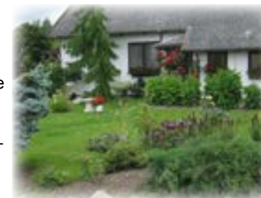
Nedsivning i græsplæne.

Vi vil her vise en række eksempler på, hvordan regnvand kan nedsives i haven. Du kan læse meget mere om Lokal Afledning af Regnvand (LAR) via linket på vores hjemmeside: www.hjvand.dk