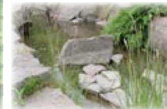
Kanal bygget af kantede sten og græsser.