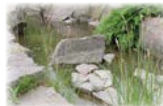
Kanal bygget af kantede sten og græsser.