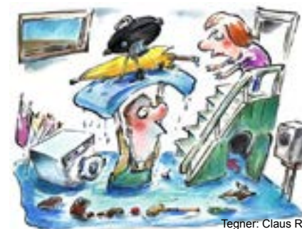
Tegner: Claus Riis