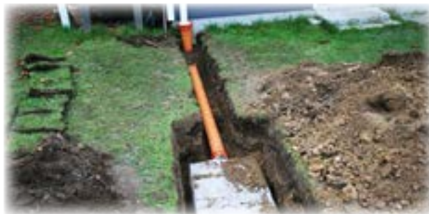
Nedgravning af faskine.