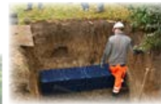
Faskine (plastkassette) nedgraves.