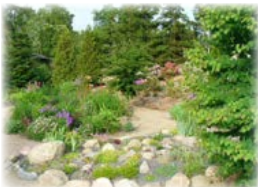
Tagvand ledes til regnbed i haven.