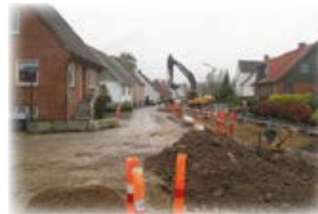
Separatkloakering i vejareal.

Der vil være kortvarige gener, mens vi graver vejen op, fjerner de eksisterende fællesrør (hvis ikke de kan genbruges) og lægger to nye rør, samt stikledninger ind til de enkelte grunde.