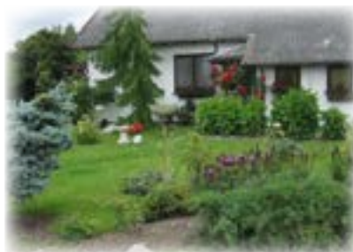
Nedsivning i græsplæne.

Vi vil her vise en række eksempler på, hvordan regnvand kan nedsives i haven. Du kan læse meget mere om Lokal Afledning af Regnvand (LAR) via linket på vores hjemmeside: www.hjvand.dk