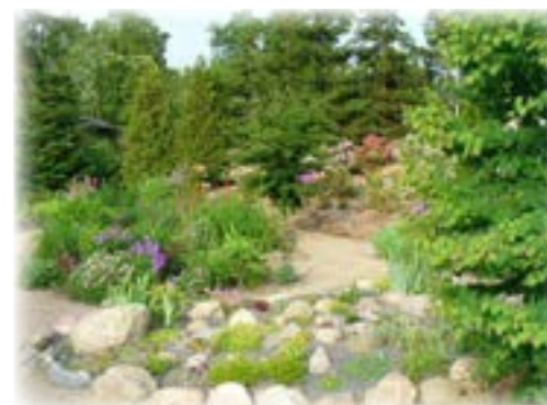
Tagvand ledes til regnbed i haven.