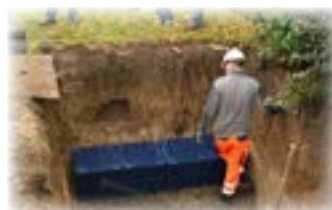
Faskine (plastkassette) nedgraves.