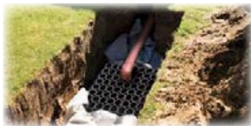
Faskine opbygget af plastkassetter.